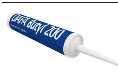
Butyl 200, tube 310 ml.