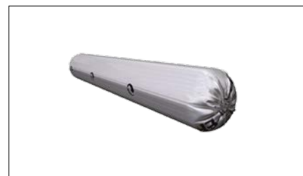
Butyl 200, pose 600 ml.