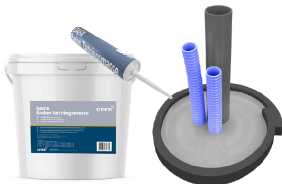
DAFA Radon Tætningsmasse (310 ml. og 5 l.) og DAFA Radon Flexibel støbeform.