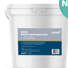
NYHED! DAFA Radon Tætningsmasse, 5 l. spand