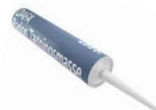
DAFA Radon Tætningsmasse, 300 ml. tube